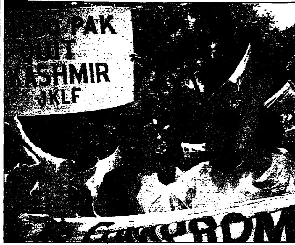
أعضاء جبهة تحرير كشمير، يشكرون في مظاهرة نظمها اسام من السفارة الهندية في اسلام اباد احتجاجا على الاتفاق الهندي.